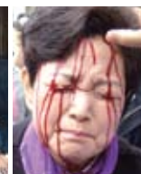
Les douleurs de la couronne d'épines