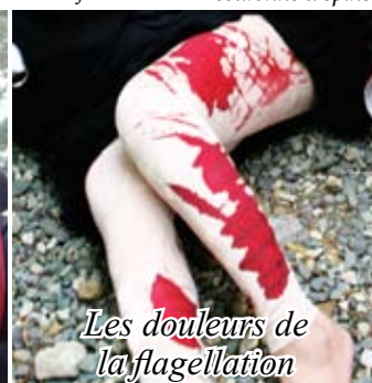
Les douleurs de la flagellation