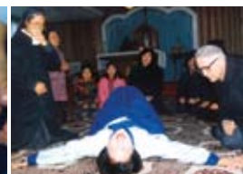
Les douleurs de la Crucifixion